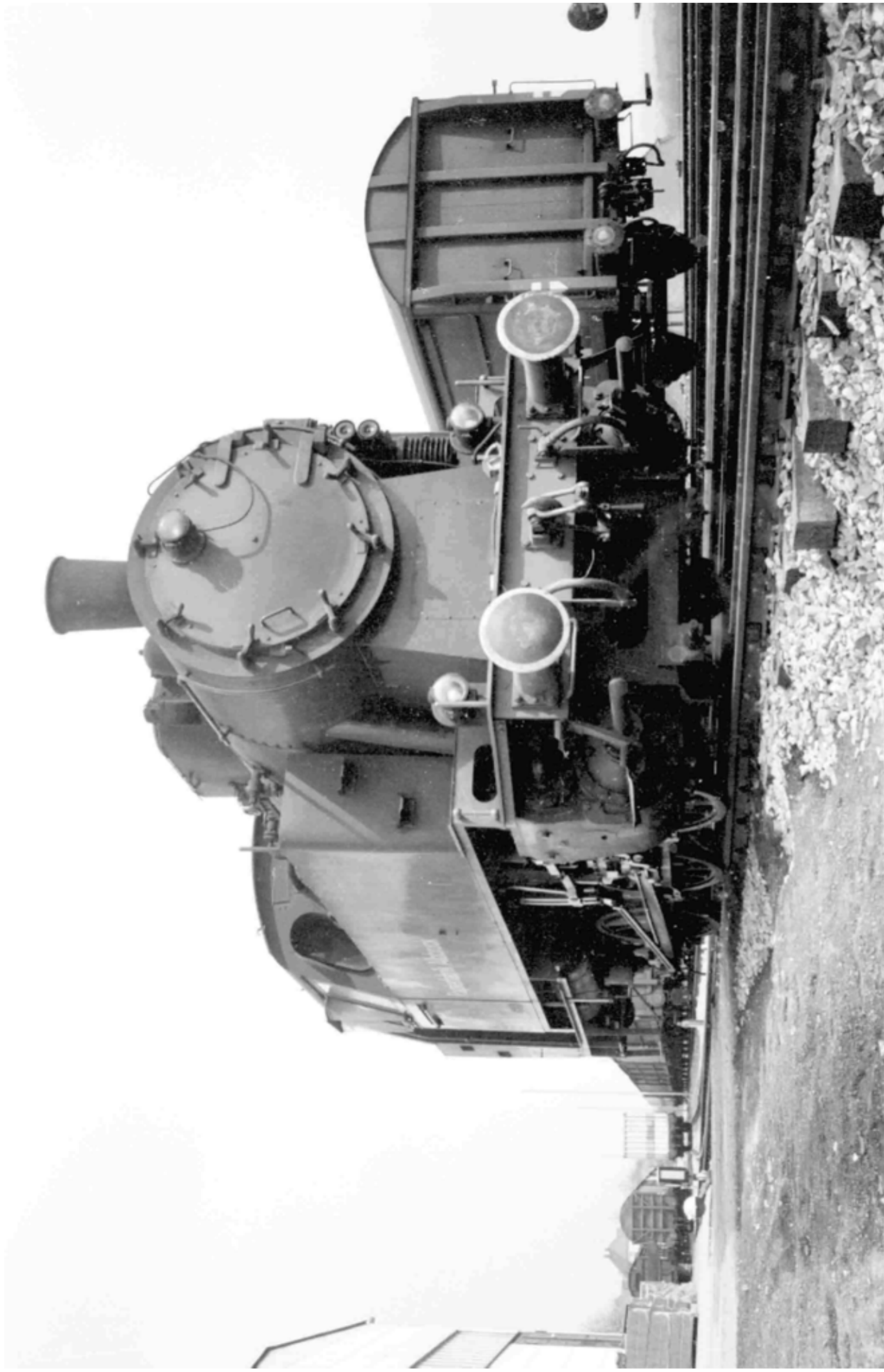
Im Jahre 1975 gab es für Lok 106 der Papierfabrik Albruck noch viel Arbeit.